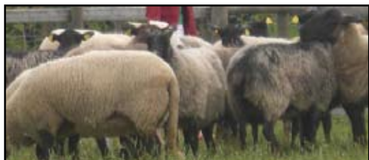
Lambi diskuterar utgången av årets Schack-SM med de andra fåren i Rinnebäcksravinen.