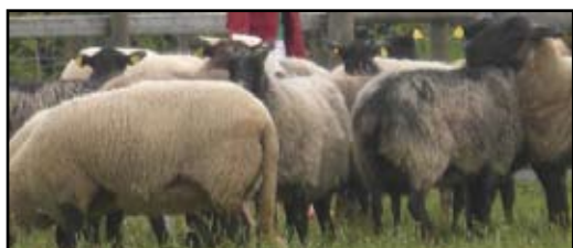
Lambi diskuterar utgången av årets Schack-SM med de andra fåren i Rinnebäcksravinen.